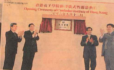
理工大學的孔子學院剛於五月開幕，致力推廣漢語和中國文化。

現時不少國家都面對漢語教師荒，內地每年須派出志願普通話導師，支援漢語教學，已先後派出二千名前赴東南亞。目前每年有八萬多外國留學生到內地學漢語，估計單這個市場的教育收入每年高達二十億人民幣。漢語教師愈來愈吃香，教導外國人漢語的「對外漢語」科亦成北京、上海大學的熱門選科。