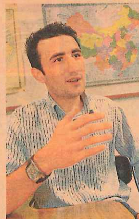
巴基斯坦人舒智勇笑言，現在全世界每一個人對中國感興趣。

他說，在美國的朋友，也要小孩學中文。自從九一後，布殊政府額外撥資源，要求國民除了主流外語