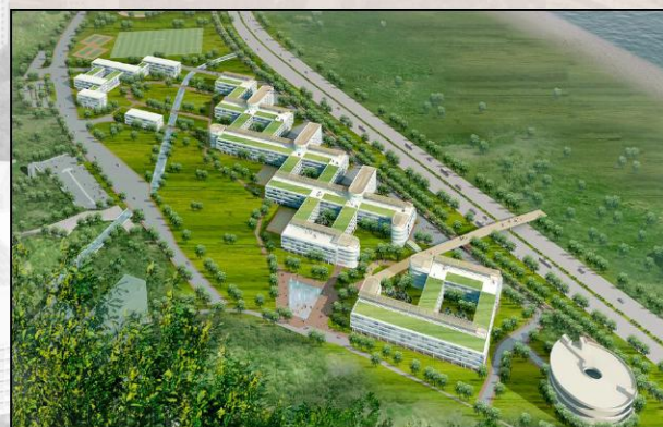
白石角新校園乃低密度規劃，配以內庭設計，令學習環境更舒適

由以上各項可見，新的總體規劃與「結合傳統與現代，融會中國與西方」的創校理念互相呼應，為締造優質的校園環境提供了理想的藍圖。