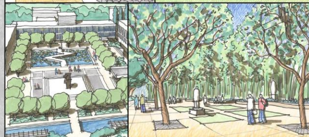
園林設計提供更多休憩空間