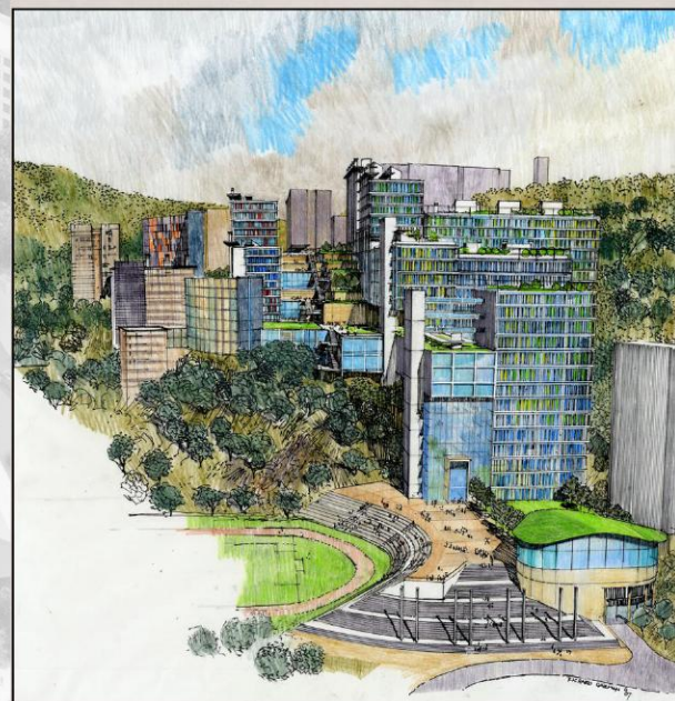
位於夏鼎基運動場側之學生廣場