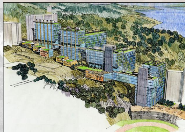
依山而建之新教學樓

第三項新設施，乃坐落於火車站旁發展密度較高的新教學大樓。這裡除教學用途外，更會成為行人交匯處，有利舉辦有助與公眾增進良好互動關係的活動。