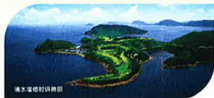
清水灣鄉村俱樂部