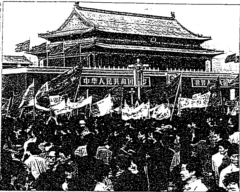
◎激進主義所引起的社會混亂是複雜的，是促使大陸民眾重新思考原有意識形態的起點。