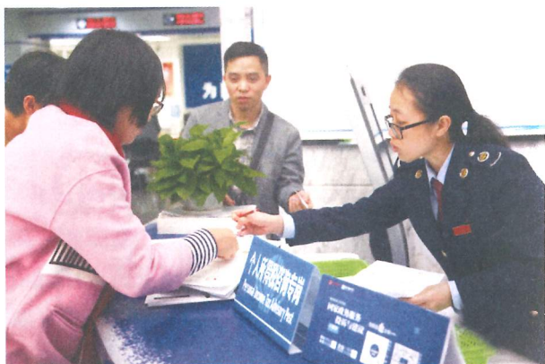
區內城市根據收入和職位，對個人所得稅予以財政補貼。圖為珠海市實施粵港澳大灣區個人所得稅優惠政策人才認定及財政補貼暫行辦法後設立的個人所得稅諮詢專崗

區內城市對有一定行業地位和專業資格的高層次人才需求，比高校畢業生更為殷切。南沙新區推出人才綠卡，以科技創新、金融和航運等重點產業以及學歷為條件，供非戶籍人才享受當地市民待遇。前海則根據業內認可、社會公認的市場化認定原則，包括收入和職位，對個人所得稅予以財政補貼。內地城市認定的高端人才和緊缺人才對成就、經驗或學歷有相當的要求，與香港青