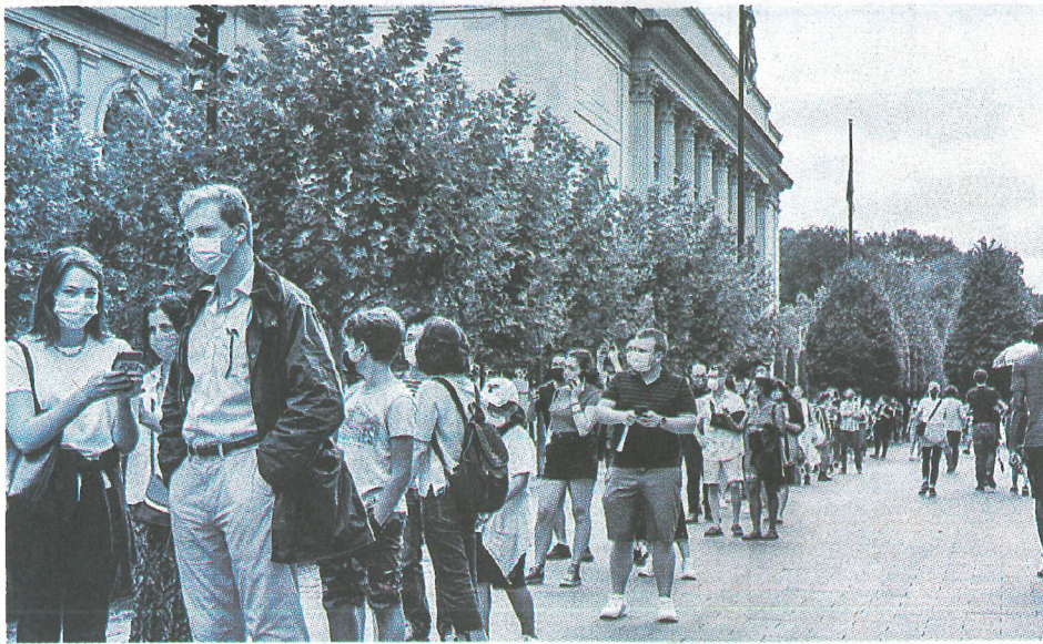
■美國疫情嚴峻，自3月以來有5萬多間食肆及零售店休業，對經濟造成很大傷害。圖為紐約藝術博物館重開，吸引大批市民排隊入場。

重溫美國經濟幾回盛衰起落，印證是回經濟災難，乃史無前例。十九世紀美國經歷4次蕭條，皆是農產品歉收，引發銀行危機。昔年農業主導經濟，春耕秋收循環有序。銀行春耕放貸，都市大銀行為鄉鎮小銀行融資；秋收後陸續清還回籠。紐約華爾街順口溜：「五窮六絕七翻身」(Sell in May, Go away)，源