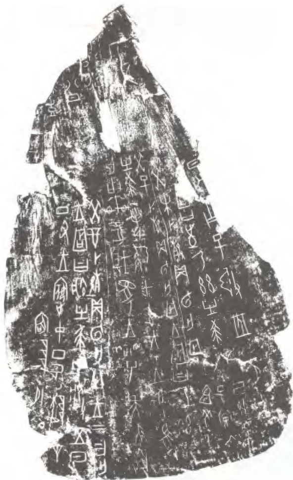
(圖二) 武丁時期的甲骨文(取自白川靜著,溫天河譯《甲骨文的世界》)

獲得三萬六千五百六十片有文字的甲骨,收穫是非常之豐富的。這批甲骨目前都仍保存在臺灣南港中研院的歷史語言研究所裏。一九四九年後,政府對考古學是非常重視和支持的。在一九七三年,中國科學院考古研究所的安陽工作隊又在小屯村南地發現了第二批有字的甲骨,共四五八九片。在一九七七年至一九八二年間,陝西岐山鳳雛村發現了第三批甲骨,有字的,只共三零三片。這一批數量雖然較少,但有兩個特點與以前發掘者不同。第一,它大體是屬於西周的,和以前完全屬於殷商的時代不同。第二,它的刻字筆畫極之纖細,大小只有零·一至零·五毫米,和頭髮的粗細(一般是零·零九毫米直徑)相差不遠,因此大部分不能用肉眼辨察,也不能傳拓,只能在顯微鏡下臨摹出來。