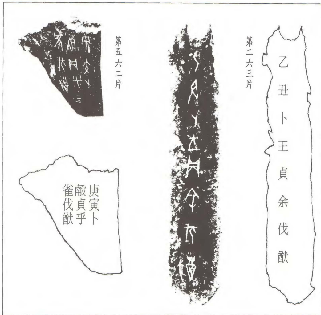
(圖三) 甲骨文拓片和它們的釋文(取自郭沫若《卜辭通纂》)

近百年來，經過好幾輩學者的辛勤搜集、整理，對絕大部分出土的甲骨文有系統地加以結集。其中最具代表性的便是中國社會科學院歷史研究所所編的十三巨冊《甲骨文合集》〔註①〕，所收的甲骨文達四一九五六片之多。關於現存甲骨文的總數，過去有人泛稱有十萬片之多，其實是誇大了！我們若把散存各處的材料確實點算一下，合起來最多不過五萬片左右而已。例如姚孝遂和肖丁兩位先生最近所出版的《殷墟甲骨刻辭摹釋總集》〔註②〕，序文裏提到所收的甲骨文數字，除去重複者外，就只有五二四八六片。這是最近總結的數目。有的著作，說據統計已發現的甲骨有二十萬片。倘若這是指刻有文字的甲骨而言，那實在是毫無實據，不可相信的。