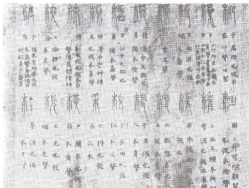
唐寫本《說文》木部殘本。據周祖謨《問學集·唐本〈說文〉舊音》插頁。