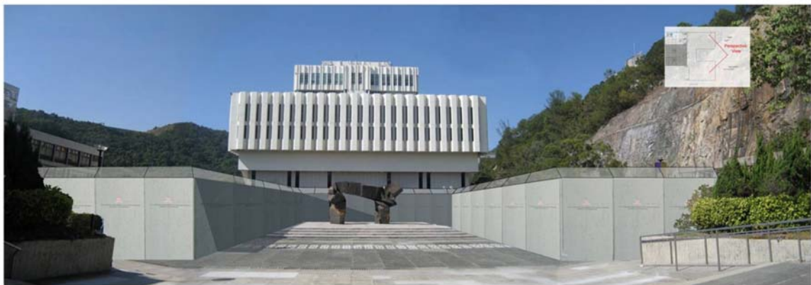
圖二： 施工前期大學廣場外觀 Attachment 2: View of University Square at Early Stages of Construction