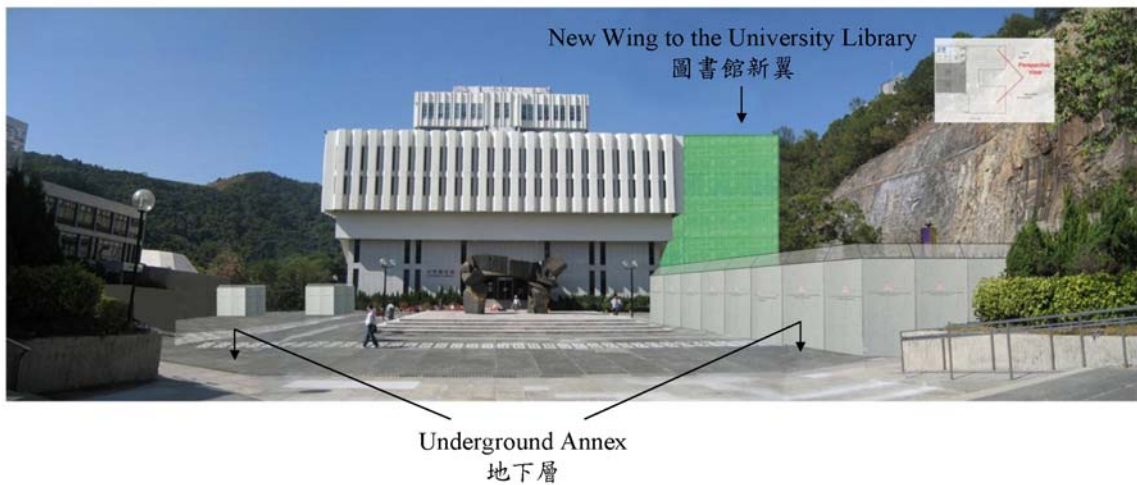
圖三： 施工後期大學廣場外觀 Attachment 3: View of University Square at Later Stages of Construction