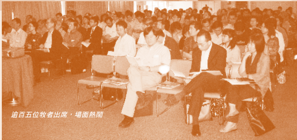
逾百五位牧者出席，場面熱鬧