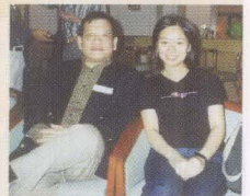
現任公務員事務局首席助理秘書長朱燦培校友與伍靄雯校友。