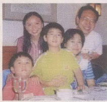
家人和第一個學妹 凌苑陶攝於雙魚河會所

不要以為學長計劃只是學長和學弟、妹的交流，其實我發覺這個計劃亦加強了學長們之間的溝通，亦增加了和書院的接