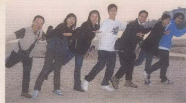
與學長員打成一片。

參加了學長計劃，不但傳承了學長幫助學弟學妹的傳統，也令我有更多機會和其他學長交流、返回書院活動，生活多了不少色彩，實在是一個利己利人的活動。最後更要多謝岑才生主席給我們的資助，令我們一直都得到很好的支援。希望可以見到更多的學長和同學加入我們的行列。