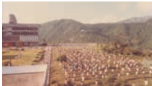
迎新營每天早上的集體操。

洗禮和儀式當不止此。數愛國歌曲/民族情懷的歌曲，還有《中國海》、《歌唱祖國》、《遠航歸來》、《保衛黃河》、《神州之歌》等等。當然，還有來自台灣的《龍的傳人》和其他校園民歌。假若大家忘了這些歌曲，相信總會記得在大群人聚集、鬥歌、比賽時、抑或等候活動開始時最常唱的《蘋果園》。