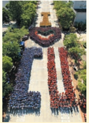
本年度書院新生輔導營的「人體砌圖」於8月27日在大學百萬大道進行，圖中最高位置的「人」字為聯合書院的新生。

自新生輔導營出現以來，同學籌備輔導營的主調仍以認識書院、建立歸屬感為主軸，沒有重大改變。雖然輔導營的宗旨沒有改變，但他在近年來卻有感覺上的變化，林先生表示：「早年的籌委多著重服務同學，希望同學在輔導營中能接收最多的訊息，角色較為抽離。但近年來，籌委更投入活動，與新生享有更多共同參與的機會。他們除了投入時間和心思外，也會自發投入更多物質，例如自費購買小組飾物等。」