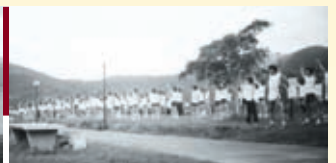
輔導營攝影師李劍雄校友的兩幅傑作——宏偉的早操。