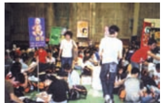
輔導營的開幕情況。

石校友表示，輔導營除了為他帶來難忘的回憶外，也是一個很好的訓練。他表示，在對外事務方面，他要接觸輔導處、院長、社監，對內則要管理一個三十多人的團體，是一個非常難得的機會，使他學懂處理人與人、部與部之間的關係，對日後的工作大有幫助。