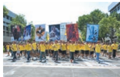
四院會師中聯合同學的氣勢。

多年來，聯合書院新生輔導營都面對缺乏籌委的難題。相比崇基學院因為申請同學太多而需要進行籌委遴選面試，我們卻要不斷的宣傳，希望能找到足夠的人手，這境況實在令我感到心酸，但這亦使我們每一位聯合書院新生輔導營籌委的工作顯得更為重要，更值得尊重。