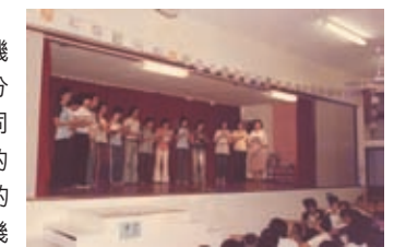
於湯若望宿舍禮堂文藝晚會介紹學生會幹事會。