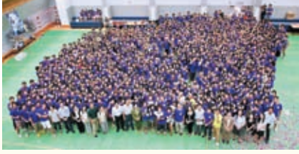
本屆新生輔導營開幕禮後，一眾嘉賓與參加輔導營的學生於張煊昌體育館合照。

自新生輔導營出現以來，同學籌備輔導營的主調仍以認識書院、建立歸屬感為主軸，沒有重大改變。雖然輔導營的宗旨沒有改變，但他在近年來卻有感覺上的變化，林先生表示：「早年的籌委多著重服務同學，希望同學在輔導營中能接收最多的訊息，角色較為抽離。但近年來，籌委更投入活動，與新生享有更多共同參與的機會。他們除了投入時間和心思外，也會自發投入更多物質，例如自費購買小組飾物等。」