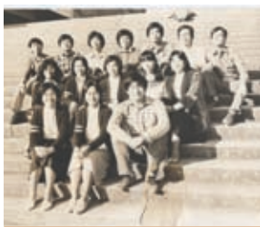
第二十屆學生會幹事會負責籌辦 1982 年的新生輔導營。

或許，這一首歌就是我們這些在殖民地時代入讀一間背負著理想的「中國人大學」的新生必須接受的洗禮和儀式。