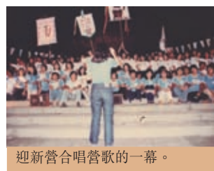
迎新營合唱唱歌的一幕。

洗禮還包括，每天早上的集體操。睜開或睜不開惺忪的睡眼，也要每早 7 時(或是 7 時 30 分)到胡忠圖書館前草地一起做早操。這是建立集體感的方法罷。縱使早一天晚睡甚或沒睡，都得準時出席、不得有誤。