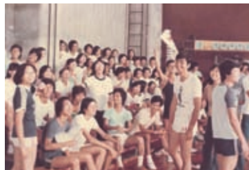
攝於聯合書院體育館舉行的新生輔導營活動。