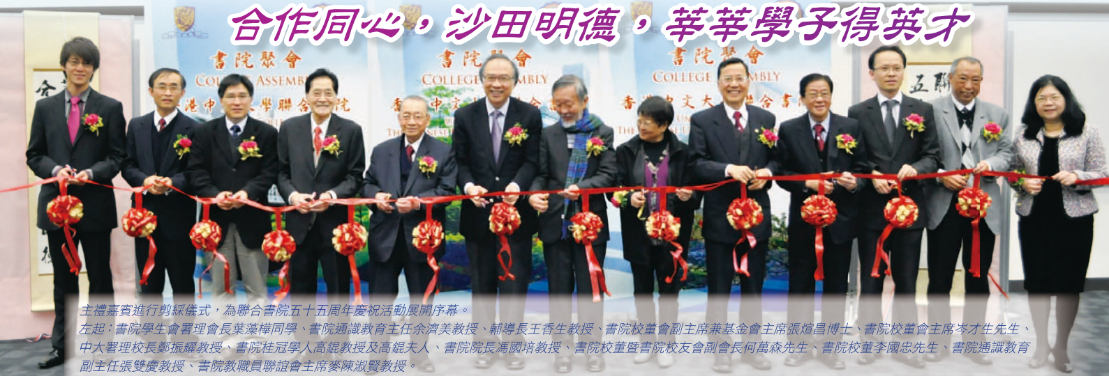
主禮嘉賓進行剪綵儀式，為聯合書院五十五周年慶祝活動展開序幕。