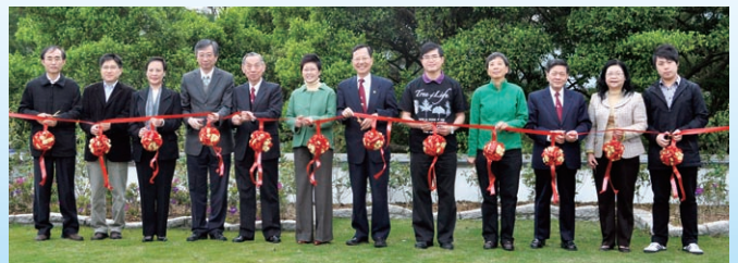
主禮嘉賓進行剪綵儀式。

書院已於2011年3月5日舉行綠色校園啟動暨樹木導賞，活動先由院長馮國培教授及環境局副局長潘潔博士致辭，並由各主禮嘉賓進行剪綵儀式，象徵校園兩項綠化工程——鄭棟材樓二樓平台綠化及胡忠多媒體圖書館對開草地改善工程完滿竣工。隨後由香港中文大學樹木計劃召集人暨綠色生活教育小組聯絡人左治強先生帶領三十多名校友、教職員及同學，遊覽聯合校園，並介紹於校園內具特色的樹木。參加者最後前往李兆基樓參觀「中大樹木之科學與藝術」展覽，了解校園內具特色的植物，實在獲益良多。各人亦為聯合校園內的樹木掛上樹牌，加強對校園內樹木的認識。