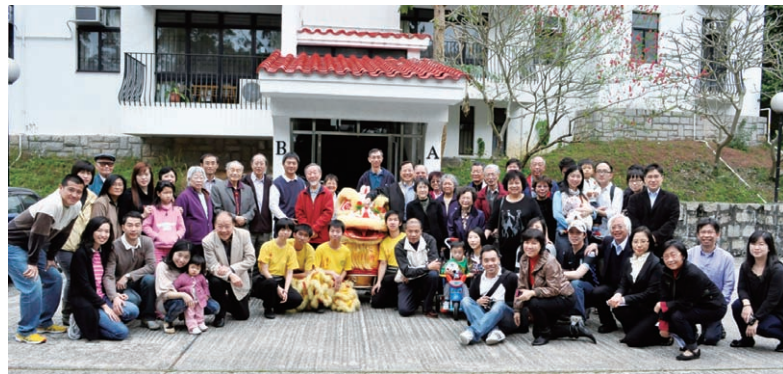
新舊住客及家屬於聯合苑前大合照，濟濟一堂。

聯合書院教職員宿舍「聯合苑」自1975年2月落成入伙，轉瞬間已卅五年。適逢今年亦為聯合書院五十五周年紀念，為誌其盛，書院教職員宿舍管理委員會於2011年2月26日上午舉行慶祝會，並邀請了現居於該處或曾入住於該處的同仁攜同家眷出席參加。當日節目包括聯合書院國術會的醒獅表演及由書院及住客預備的美食分享，與眾同樂，大家一起把手「話當年」，約七十人參加。