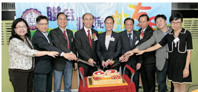
眾嘉賓主持校友日生日會切餅儀式。