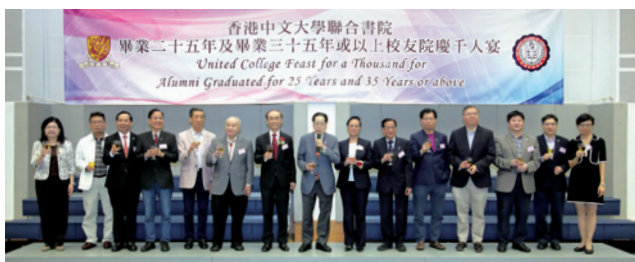
嘉賓與全場校友祝酒。