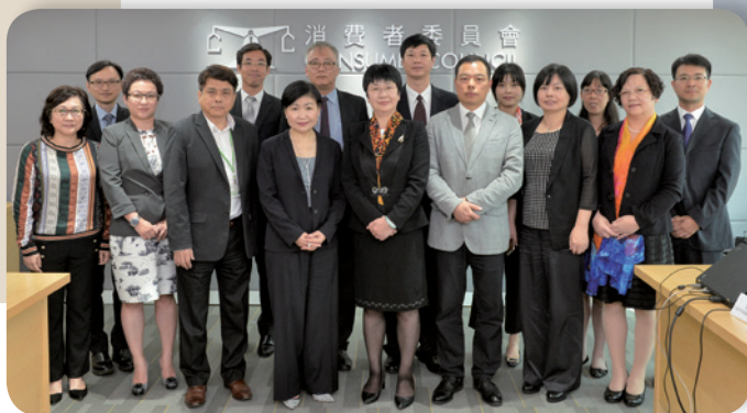
與寧波市消委會簽訂合作協議。