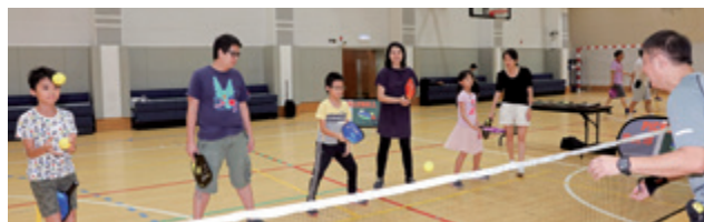
校友及家人使用體育設施。