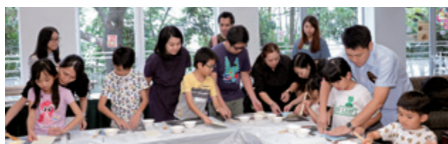
親子蝴蝶酥工作坊。