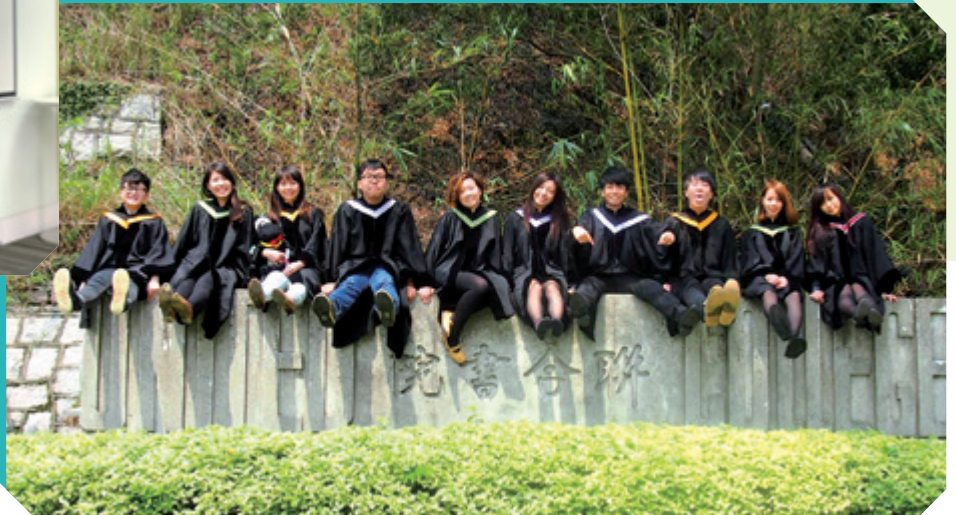
曾覺知校友（右五）與百全堂的莊員畢業時合照。