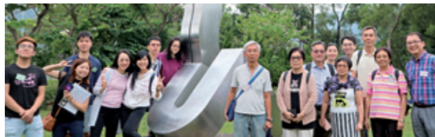
校友及家人參觀書院校友徑及各項設施。