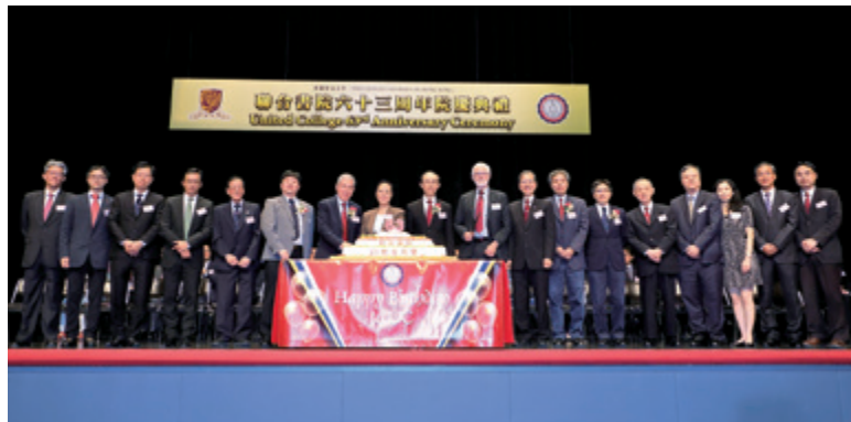
眾嘉賓主持切生日蛋糕儀式。