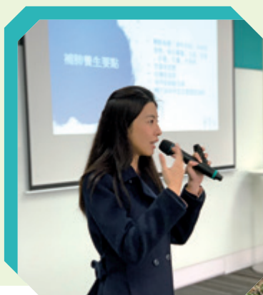
曾覺知校友已主講逾一百五十場中醫保健講座。

繼續憑實力憑努力去走出自己的道路，也為後來者開拓境界，似乎是幾位同樣醉心治人治未病的校友共同的願望。