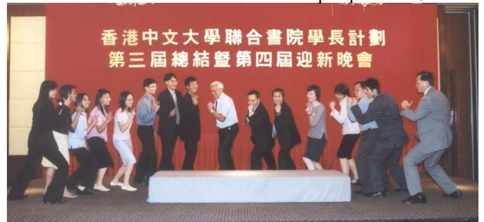
▶ 學長學員享用豐富晚餐之餘，大會更安排第四屆學長學員以最短時間互相認識，運用最佳創意作自我介紹。 Mentors and mentees entertained the guests with a performance of improvisation.