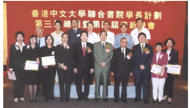
▶ 為答謝多位連續服務三年的學長，書院及校友會特向他們頒贈感謝狀。 United College and the Alumni Association presented a certificate of thanks to mentors who have supported the programme for three consecutive years.