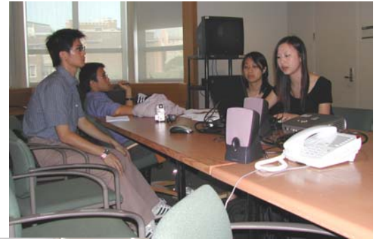
▲ 聯合同學講解他們的專題研究“Mobile Computing”的內容。 UC students presenting their project titled “Mobile Computing”.