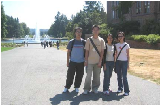
▲ 四位萌芽學者於華盛頓大學門前合照。 UC budding scholars at the University of Washington.