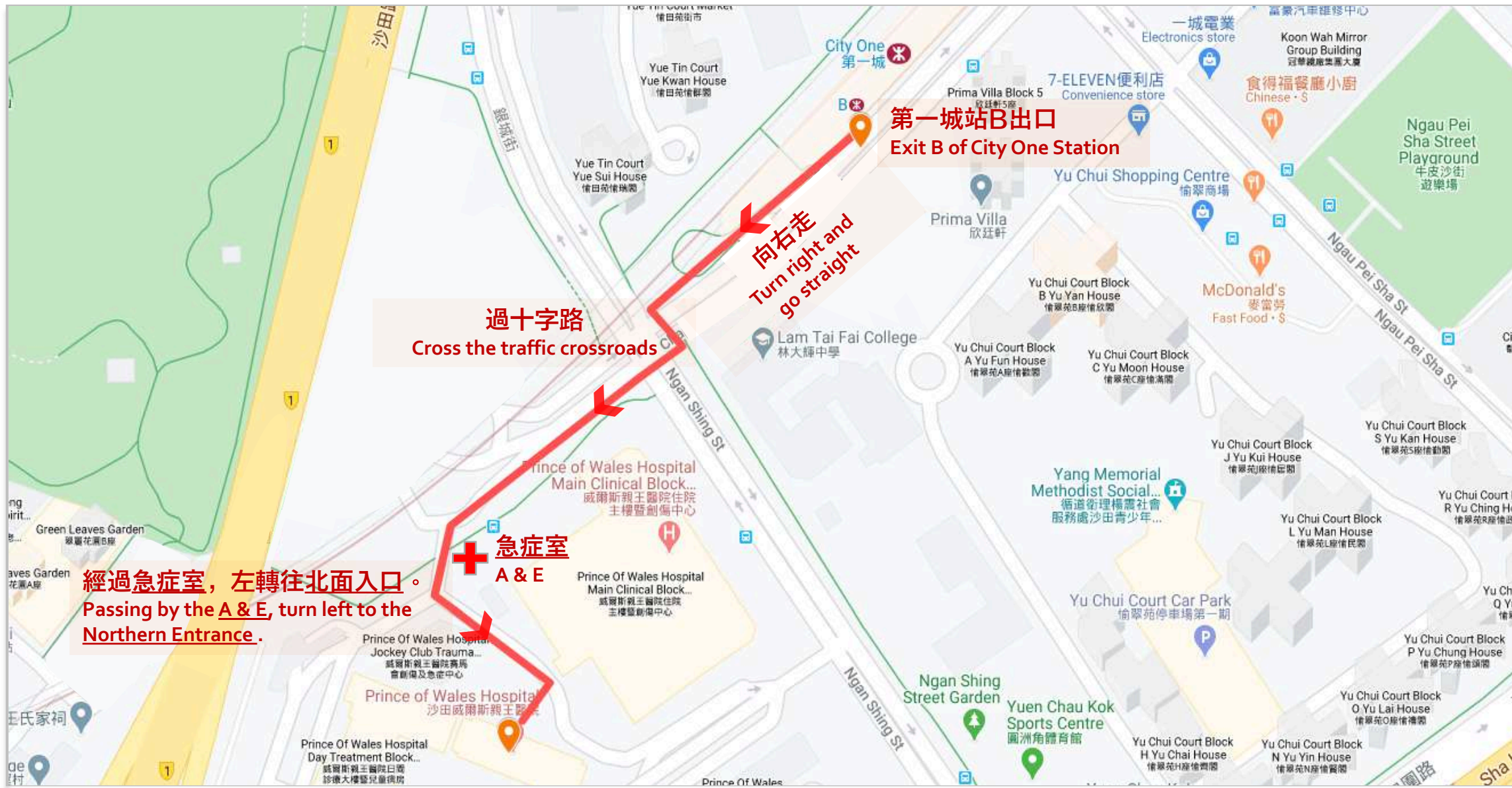
MTR City One Station → Prince of Wales Hospital Routes Map