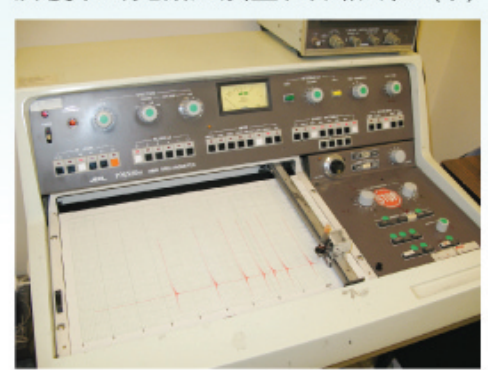
Joel JNM-PMX60si 所獲取的光譜必須畫在方格紙上(下)