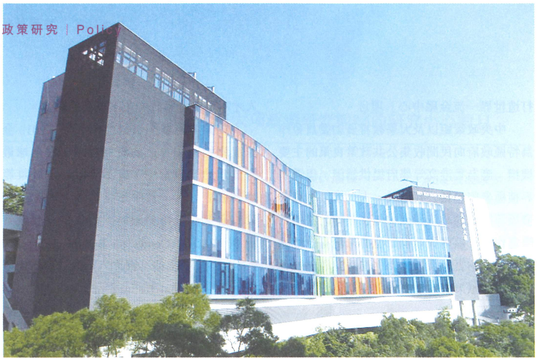
香港中文大學擁有共 5 所涉及 3 大政策研究範疇的研究中心，為香港 8 所大學之首。圖為香港中文大學逸夫科學大樓

一般都同時兼顧政治、經濟、社會各大領域，主題多集中於當前社會問題，導致一些重要而技術含量較高的政策研究長期被忽略。至於商會和專業團體的政策研究，都主要以其團體利益為依歸，有局限性。