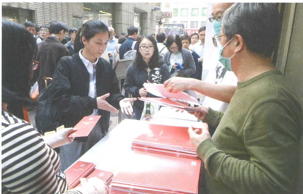
近年香港出現的不少經濟社會問題，其中稅務改革、醫療及福利開支上升、退休制度爭議、特區政府持續「派糖」等，便是由公共財政政策衍生而出。圖為路邊攤位正在派發 2018 年度財政預算案小冊子

相對外國擁有專項政策研究的智庫，香港現時約有 30 多個智庫，其中較活躍的約有三分之一，這些組織除了少部份較明確地針對特定的政策領域外（如「新力量網絡」專注政制發展、「一國兩制研究中心」專注香港內地關係、「思匯」專注環保議題），