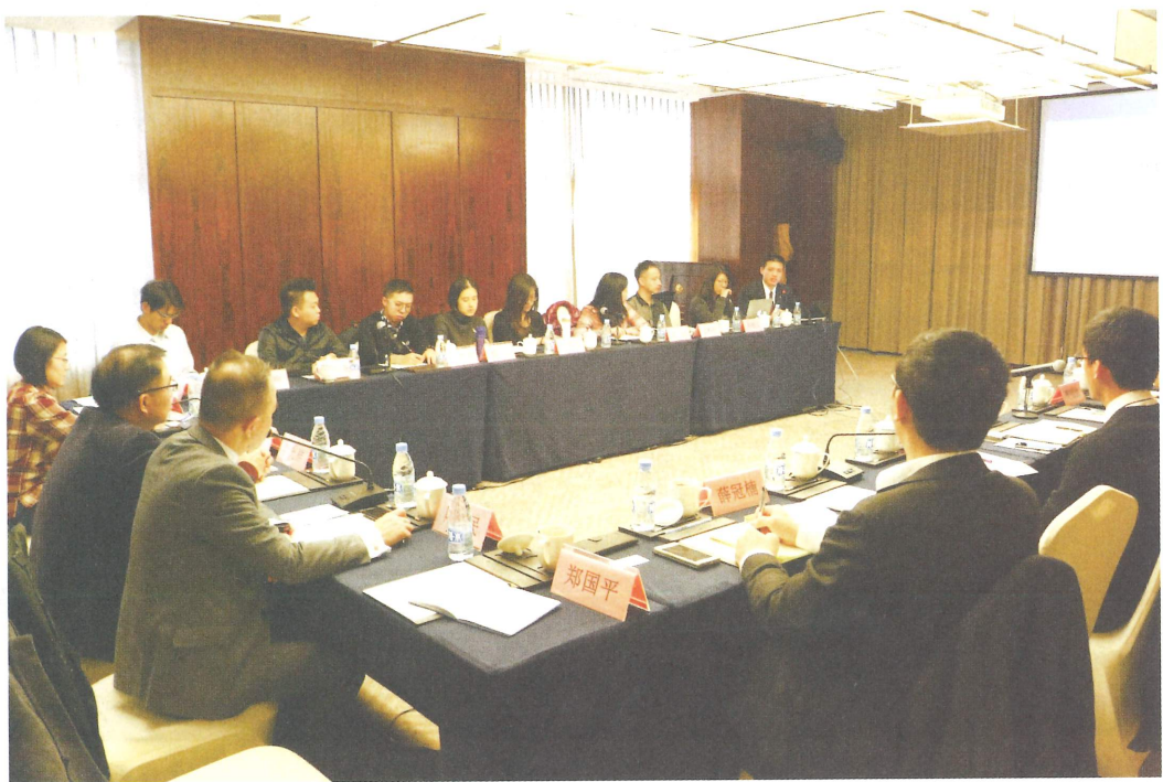
在先進的經濟體系中，除了大學研究中心外，高質素的民間智庫亦是一個主要的公共政策研究來源。圖為早前香港智庫團體代表在安徽省考察、座談