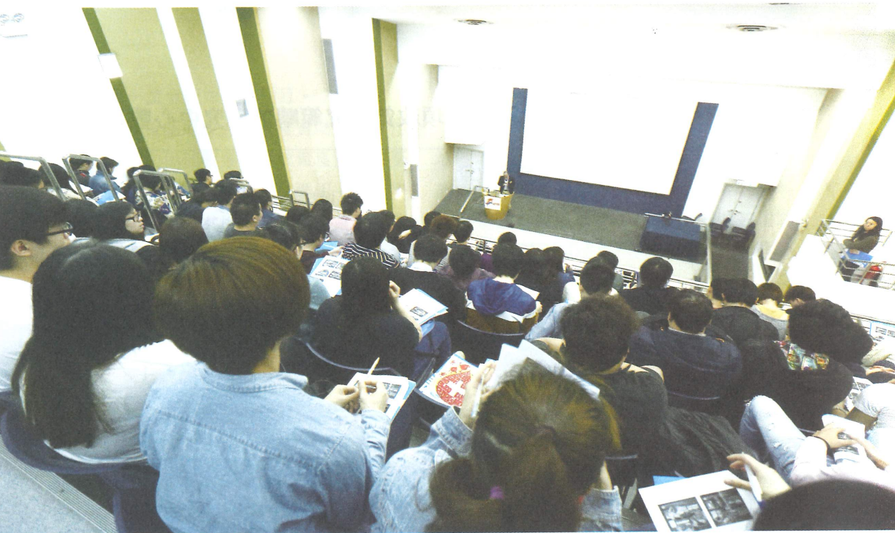
由於回歸後各屆特區政府領導層的理念和施政重點各有不同，導致一些影響深遠的長遠政策被忽略，或沒有持續性。圖為早前香港專業進修學校舉辦的社會發展論壇

就開徵相關稅項公開諮詢時，社會大眾（包括各主要政團）卻因為消費稅的負面影響表示強烈反對，最終特區政府只能宣布擱置該政策。由此可見，特區政府原本的研究並不够周全，對社會的反響也評估不足。