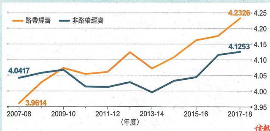
「路帶經濟」與「非路帶經濟」的「提升效率要素」平均分比較 圖3