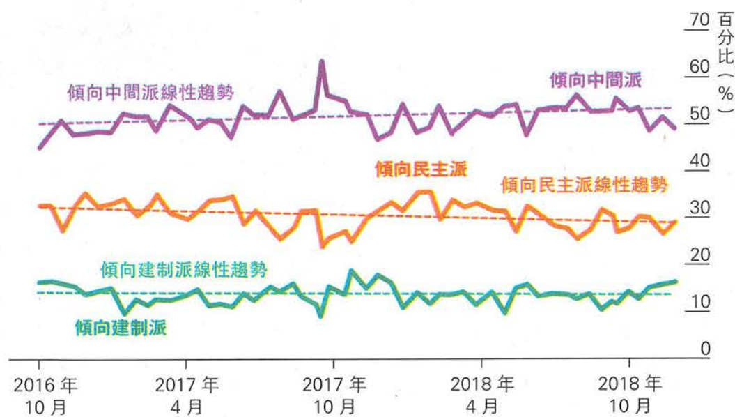
圖 2：港大民研：香港市民的政治傾向

遠。其實，大部分市民皆不參與投票，甚至不是選民，而不熱中於發聲的市民，相信更有機會屬於溫和派，所以選舉結果未必能反映香港真實的政治版圖。所謂泛民主制的「六四比」是由於政治兩極化所致，還要受投票意欲、政綱議題、競選策略、個人魅力等因素影響，歷史已證明「黃金比例」並非牢不可破。政治板塊移動影響深遠，去激進化與溫和政治在最近一年半急速興