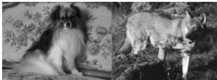
犬 (左) 與狼 (右)：它們的確是一脈相承的。

③ 巴寶和史東金所研究的是並無生理功能的一段mtDNA，它的變異是中立，不受進化壓力影響的，因此可用以測定不同種屬的分支年代。詳見註②的解釋。