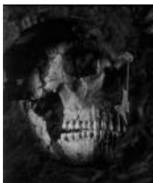
尼人頭骨：並非歐洲人的祖先

非洲」論 ① 的強力衝擊。現在，它可能已接近壽終正寢了，原因是「出於非洲」論所根據的分子生物比較法竟然已被直接應用到141年前在德國 Neander Tal所發現，而現藏於萊茵民族博物館的尼人遺骸上去了。