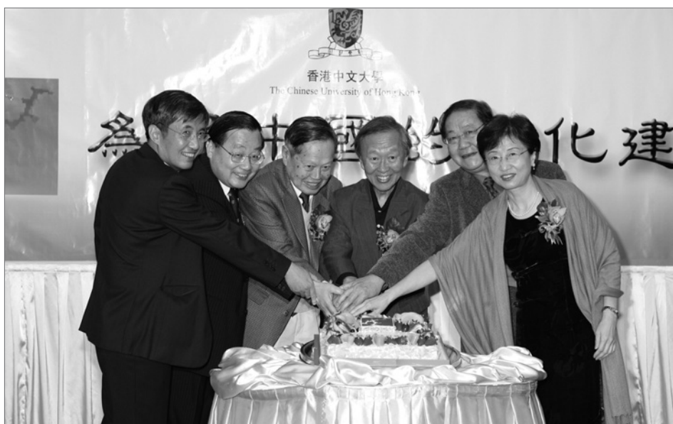
《二十一世紀》出刊百期晚宴，攝於沙田馬會，2007年3月2日。

楊先生深知長期堅持辦一份非牟利的思想文化刊物，對中國的文化建設具有重要意義。刊物籌辦初期，楊先生曾多次問這樣一個問題：一本很好但只辦一兩年的刊物，比起一個水平稍遜但能堅持十年的刊物，哪一個更有價值？青峰在1995年刊物出版五周年的「編者的話」（1995年10月號）中寫道：「楊振寧教授曾為我們提出這樣一個初步目標：最少要把《二十一世紀》辦到二十一世紀。不知不覺，這目標已完成一半了，但那其實也只能算是我們真正的起點而已。」2007年3月2日《二十一世紀》在沙田馬會「旺灣樓」舉辦了慶祝出刊百期的晚宴，青峰也正式卸下編輯重擔。楊先生在受邀講話中說，創