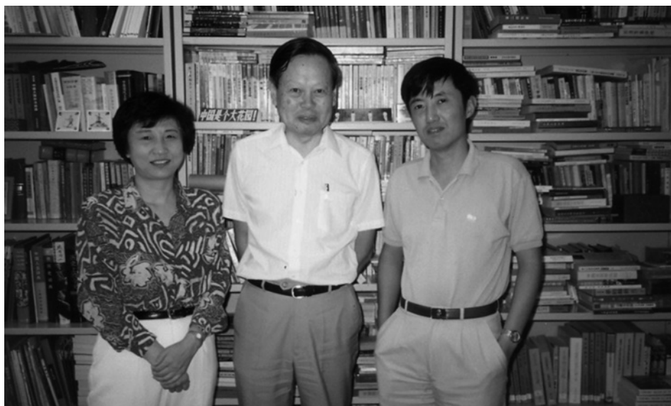
楊先生和我們，攝於中國文化研究所，1992年5月29日。

1992年5月底的一天中午，楊先生突然來到我們辦公室，說他明天要去京津等地，來拿兩本新出版的《二十一世紀》4月號，該期有他的大作〈陳省身先生與我〉。楊先生告辭前與我倆拍照並說：《二十一世紀》將是一個愈來愈重要的刊物。1993年1月中旬，楊先生同意出任編委，當晚，方正兄在通識課後來我們家，觀濤倒五糧液，三人舉杯慶賀。楊先生第一次出席編委會就提出增設「科技訊息」欄，其後方正兄自告奮勇擔起了這個責任。欄目開出後，立即受到各地不同專業讀者的廣泛讚譽。在楊先生帶動下，先後有陳省身、李遠哲、王浩、徐立之、姚期智等世界著名的數理化、生物及計算機科學家加入編委會，對推動刊物發展起到重要作用。