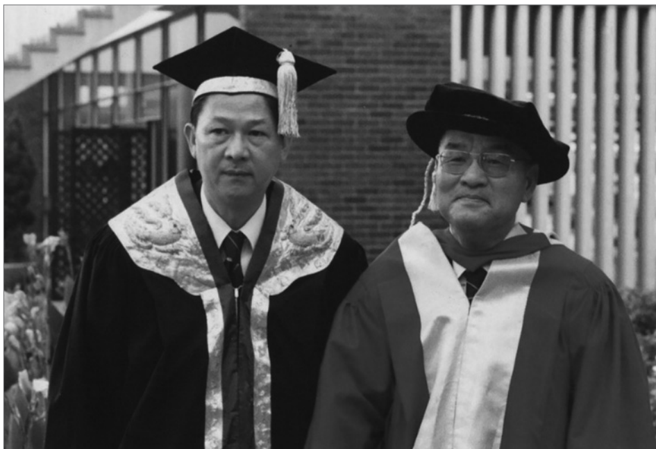
馬臨校長(左)和李卓敏校長(右)，攝於1978年。

告別，心情免不了有點沉重。好在中文大學的基礎經已奠定，我對中大的前途抱有絕對的信心。馬臨教授領導本校是理想人選，我自當盡力支持。」 ⑤