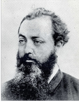
翻譯者 1 丕思業