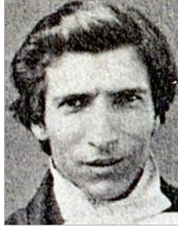
翻譯者 2 俾士