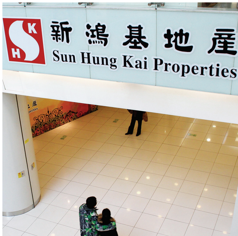
中国人强调家和万事兴，但强行合，必然导致不和，最后往往被迫分。新鸿基家族信托受益人被绑定在一起，发生内斗时想分开都很难。

财富传承的要诀与中国古老的道家思想颇为契合。成功世代传承的家族，都十分注重无形财富的传承。家族传承最主要的是将无形资产传给下一代，而非仅是物质财富。如果只注重物质财富，会越分越少，迅速消散；反之，无形财富越分越多，物质财富也随之越聚越多。 范博宏 张天健/文